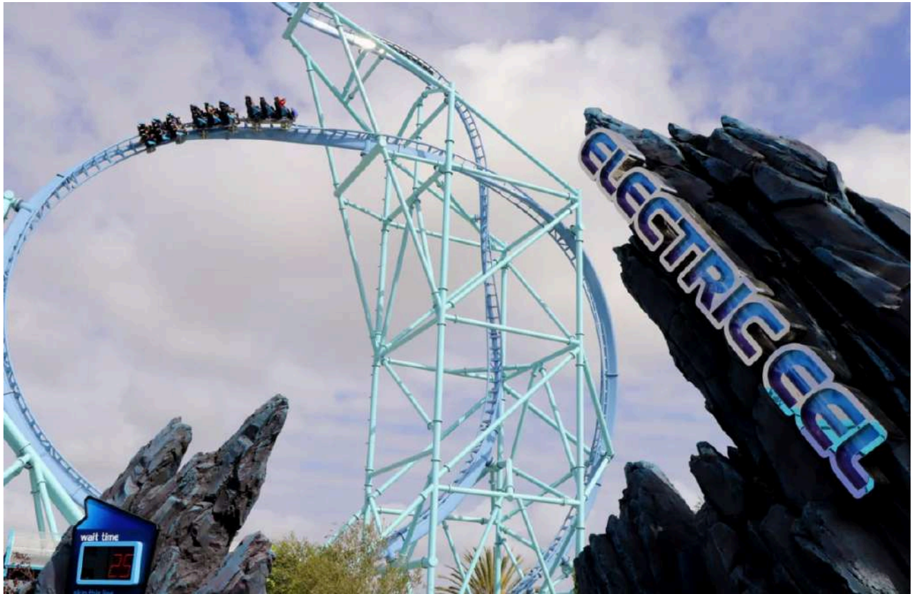
A Electric Eel é uma montanha-russa de alta velocidade com múltiplos loops.