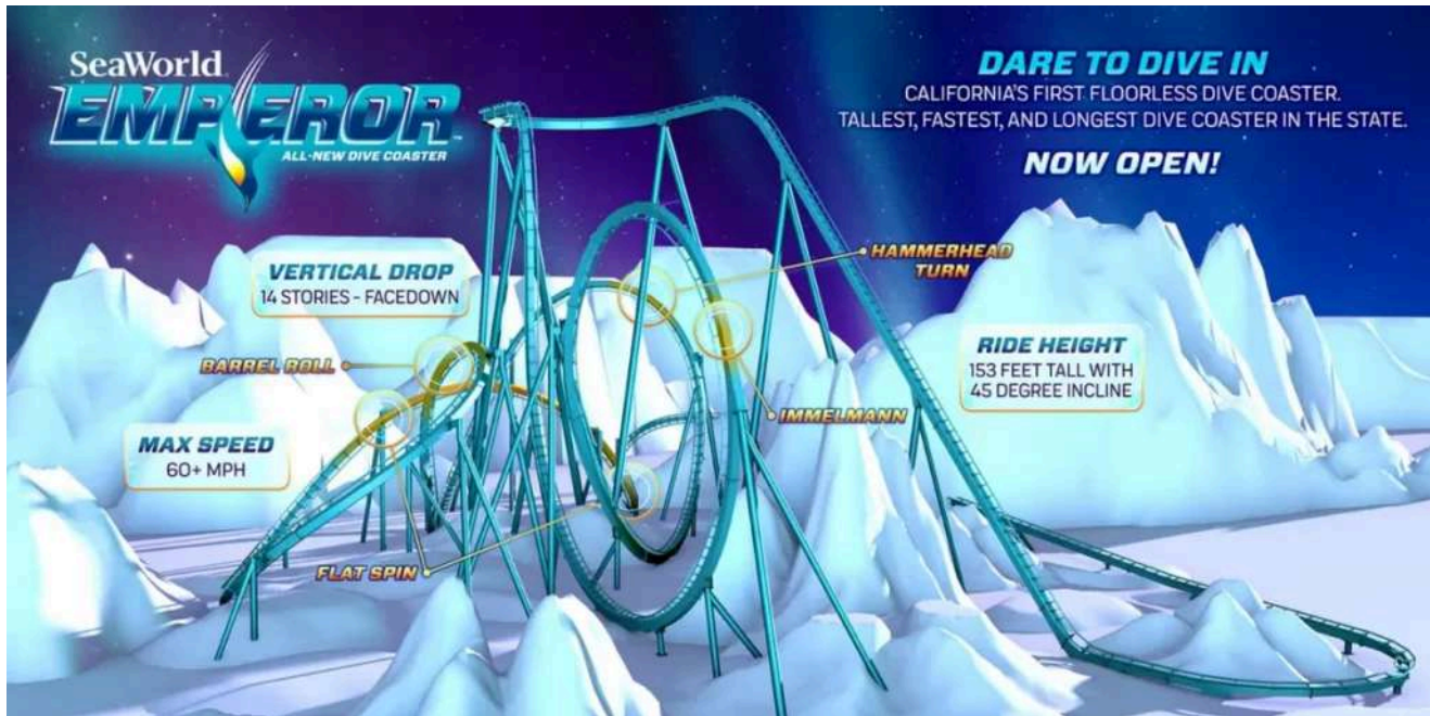
Layout e principais elementos da montanha-russa Emperor no SeaWorld San Diego .