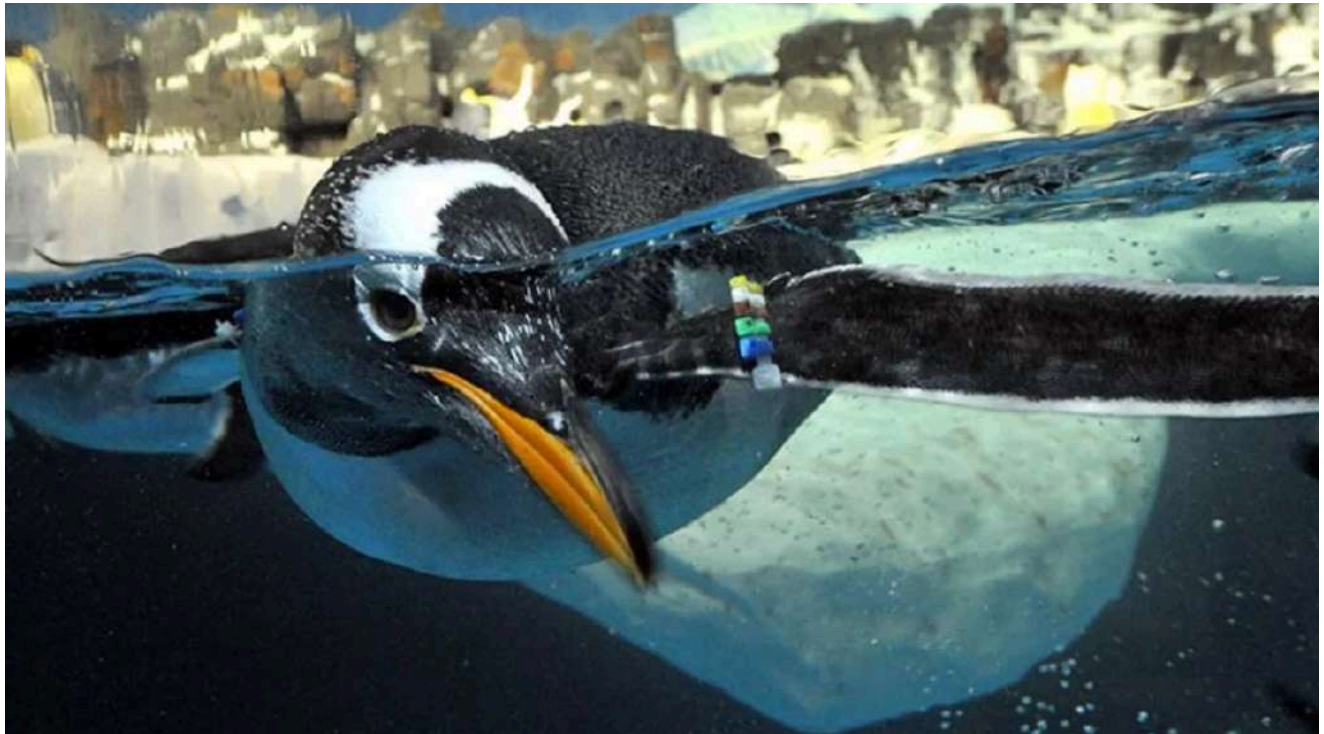
Pinguim nadando no habitat refrigerado do SeaWorld San Diego.

Minha leitura aqui é simples: para a maioria dos viajantes, o parque já funciona muito bem sem upgrade premium. Mas, se o foco da viagem é experiência memorável e você quer algo realmente diferenciado, um encontro com golfinhos ou pinguins pode fazer mais sentido do que gastar o mesmo valor em compra por impulso dentro do parque.