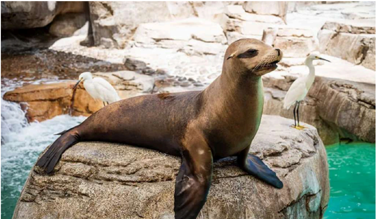
Leão-marinho em um dos habitats marinhos do SeaWorld San Diego.