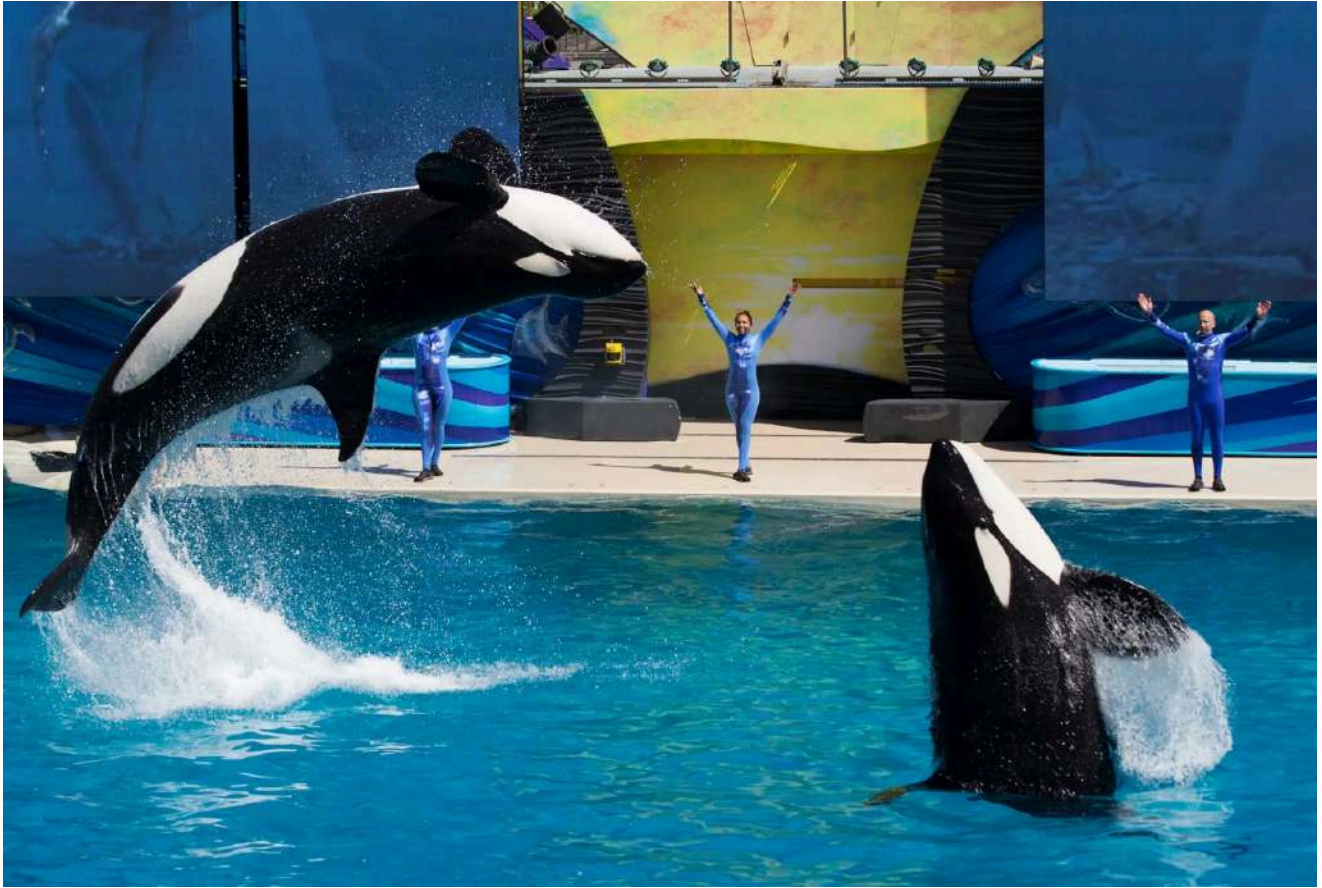
Show Orca Encounter, no SeaWorld San Diego